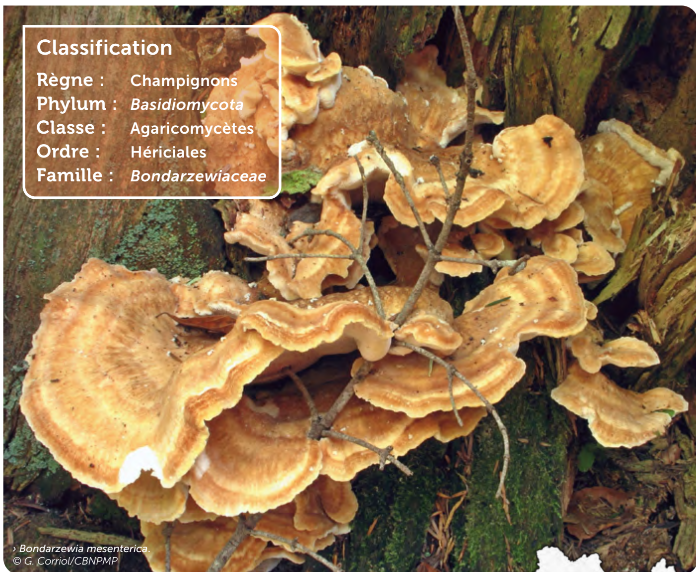
> Bondarzewia mesenterica .

Règne : Champignons Phylum : Basidiomycota Classe : Agaricomycètes Ordre : Hériciales Famille : Bondarzewiaceae