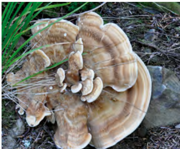
> Bondarzewia mesenterica .