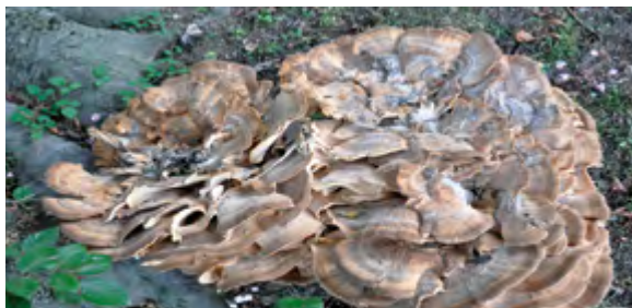
> Meripilus giganteus .