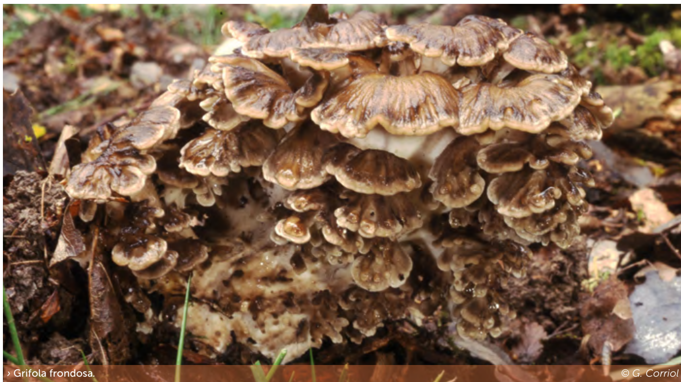
> Grifola frondosa .