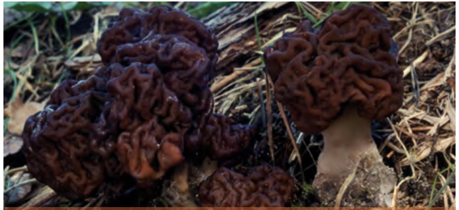
> Gyromitra esculenta.