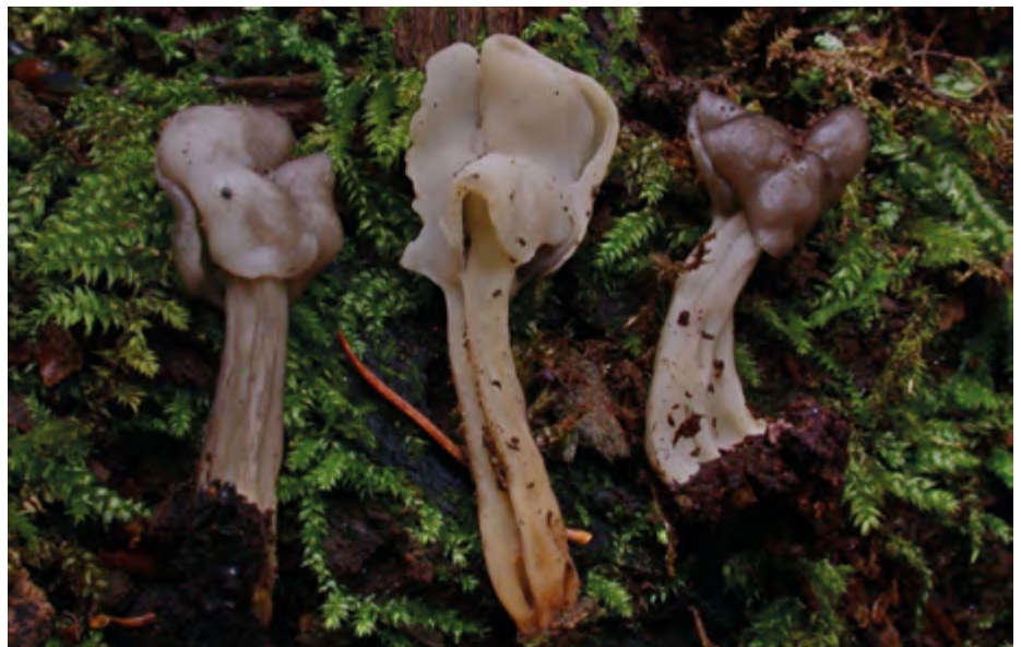
> Helvella sulcata.