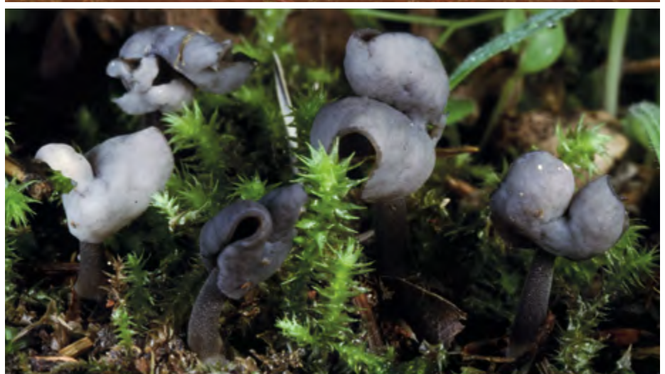
> Helvella atra.

Certaines pourraient évoquer un gyromitre bien qu'elles ne présentent jamais la combinaison de caractères de G. infula (habitat lignicole, chapeau brun rougeâtre en turban, et pied subcylindrique*).