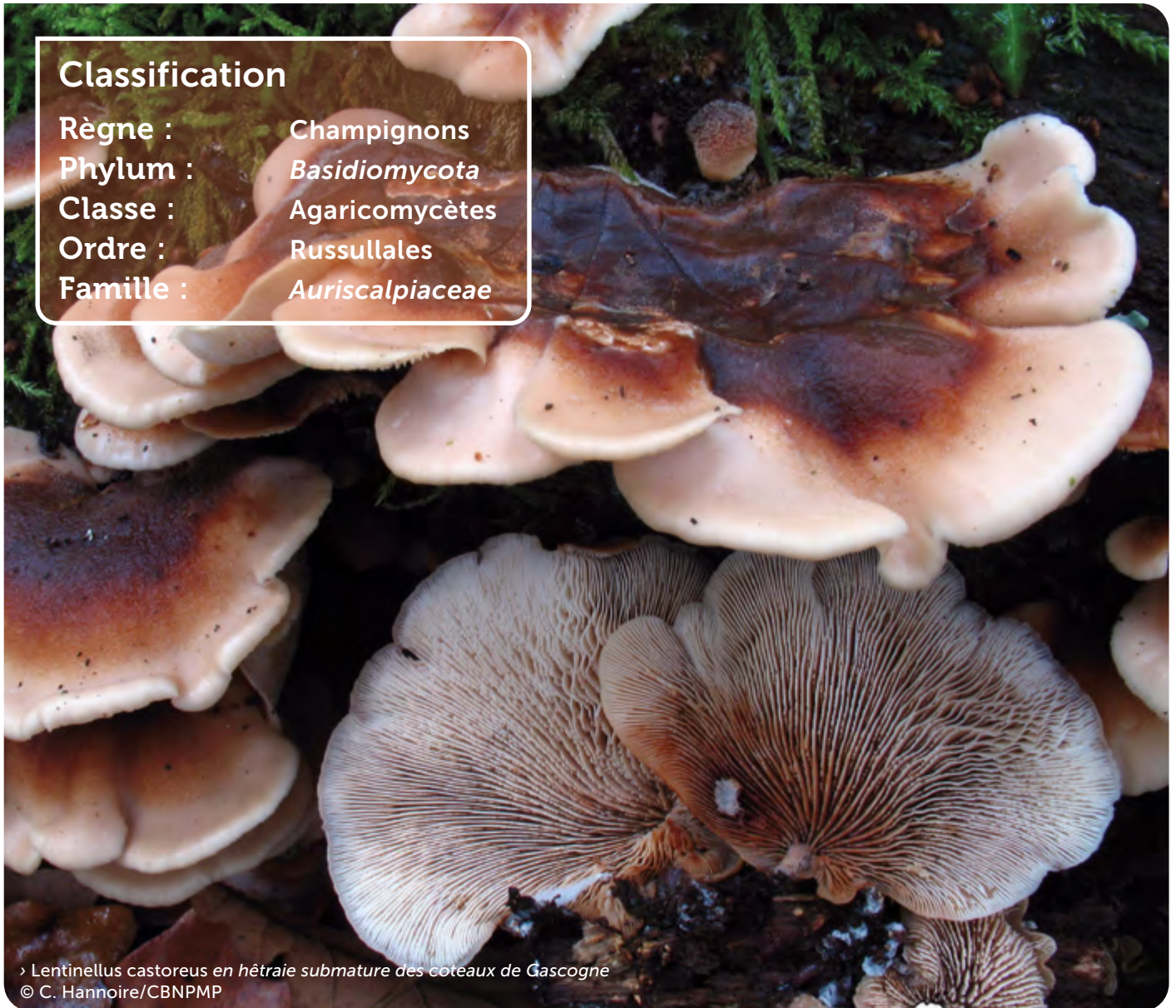
› Lentinellus castoreus en hêtre submature des coteaux de Gascogne

Règne : Champignons Phylum : Basidiomycota Classe : Agaricomycètes Ordre : Russulales Famille : Auriscalpiaceae